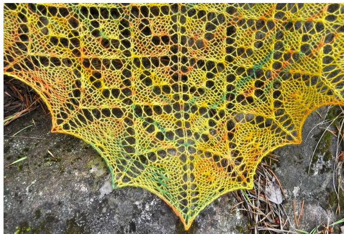
Sjalen är stickad och fotograferad av marifasmaskor.blogspot.com